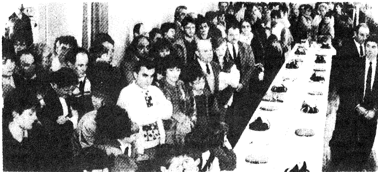
Pendant les discours à la salle des fêtes

Je ne voudrais pas terminer mon propos sans remercier Monsieur l'Inspecteur d'académie, d'avoir accepté de créer un poste d'enseignant pour la classe maternelle.