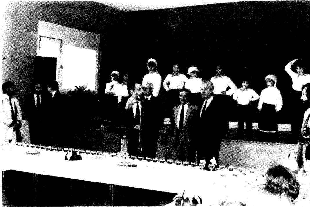
Avant les allocutions

Ce nom de Jazeneuil, qui, à l'extérieur de nos frontières communales est principalement associé à notre église du 12 e siècle, véritable fleuron de l'architecture romane dont les lignes harmonieuses se mirent dans le lit de la rivière la Vonne.